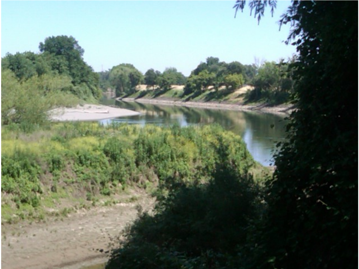
Một nhánh sông Sacramento bên cạnh đất trại

Tuy đất trại không lớn lắm nhưng cũng đủ cho các em và bà con ta vui vầy bên nhau trong cảnh thiên nhiên thơ mộng, không khí trong lành, và sẽ có nhiều kỉ niệm đáng yêu. Colusa, chưa đến nhưng rồi sẽ quen.