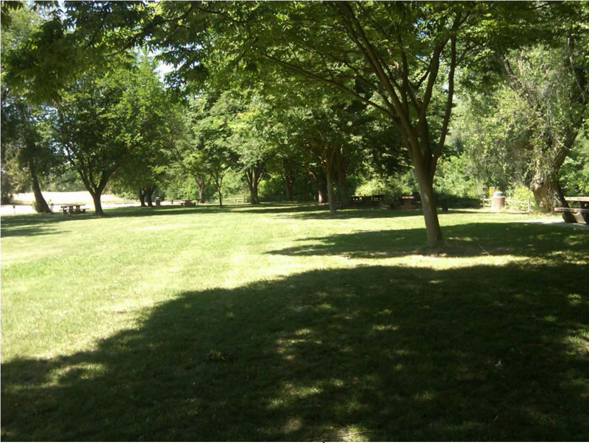
Một nửa khu cắm trại