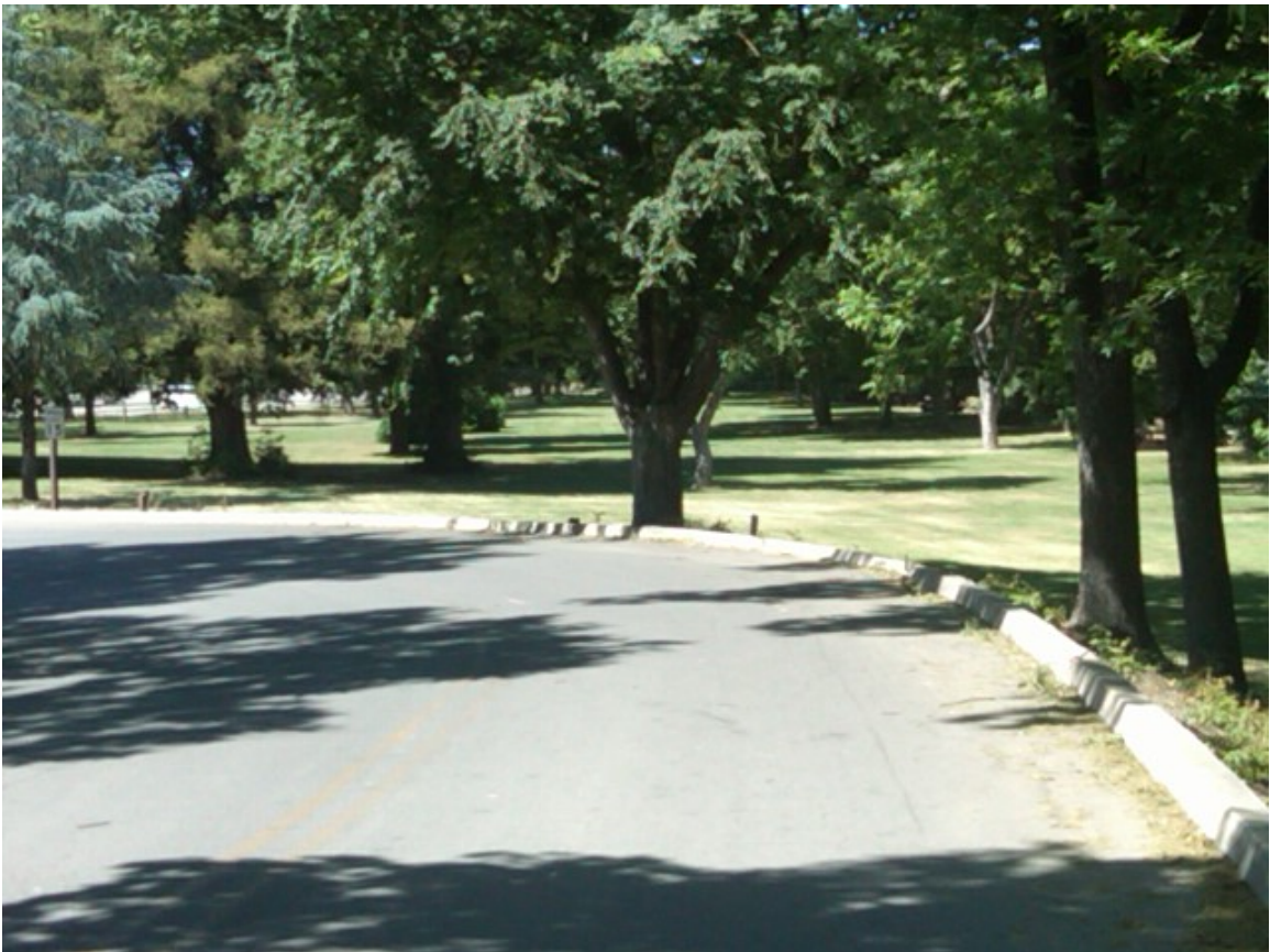
Toàn khu cắm trại của RK, nhìn từ cổng chính vào